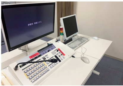
設置から10年が経過する同報無線操作卓

答 現在、使用している同報無線設備は令和八年度で設置から十年が経過し、メーカー保守期限を迎えるため、令和九年度以降に故障した場合には、修理が不能になる可能性がある。同報無線は、緊急時の重要な情報伝達手段であり、市民等の生命に直結する設備であることから、計画的に更新し、機器の安定稼働を図る。