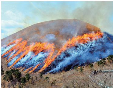
年間70万人を超える観光客が訪れるジオサイト「大室山」

答 大室山は本市を代表する観光スポットであり、年間観光スポットであり、年間を通し多くの来遊客が訪れることから、大規模な浄化槽の整備を予定している。これが事業費の約半分を占め、県の補助金を活用し整備するが、維持管理については、リフトの運営企業と協定を結び依頼をする予定である。