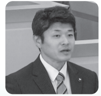
かたぎりもとゆき 片桐基至議員 (会派に所属していない)