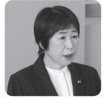
かわしま きよみ え 議員 河島紀美恵議員 (伊東未来)