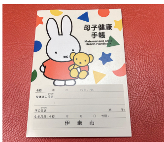
アプリの導入と併せて今後も活用されていく紙の母子健康手帳

答 母子健康手帳アプリの導入は、紙の手帳と併せてスマートフォン上で気軽に子供の情報が確認できる体制を構築し、子育て世代に対する利便性の向上を図るために実施する。内容は、子育て支援情報の配信や小児予防接種サービス等で、過去の予防接種の履歴や健診結果が容易に確認できるところで子供の養育に役立ててもらえるよう準備を進める。