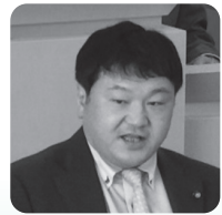
むしあきひろ お虫明弘雄議員 (自由民主 伊東)