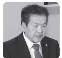
たけもと たけくに 議員 竹本力哉議員 (公明党)