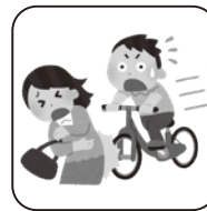
自転車による事故