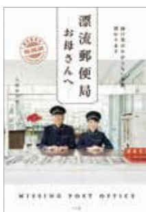
『漂流郵便局—お母さんへ—』 久保田沙耶 著/小学館

漂流郵便局とは、届け先の分からない手紙を受け付ける郵便局。そこに届いた子から母、母から子への手紙を紹介。もう会うことのできない母への思いや直接伝えることのできない子への思いを綴った手紙。当たり前に出会うことができ、思いを伝えられることに感謝です。