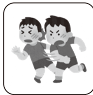
暴力や傷害行為によるけが