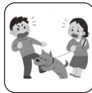
他人のペットによるけが