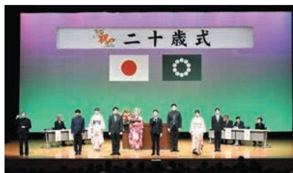
▲7年二十歳式の様子