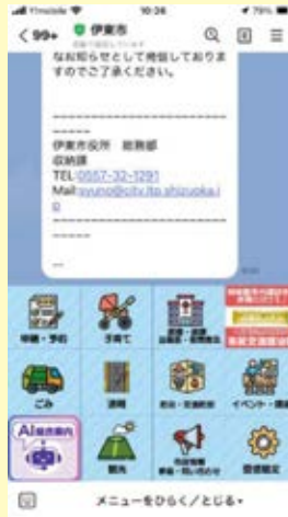
①リッチメニュー「AI総合案内」をタップ