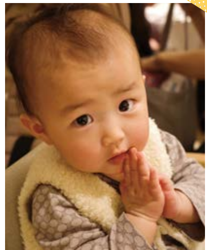
あみちゃん（1歳2か月）