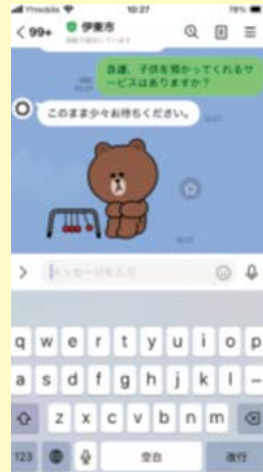
③知りたい情報を入力し、送信する。