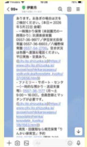
④AIが伊東市ホームページ掲載情報から該当の情報をまとめ、回答を返します。