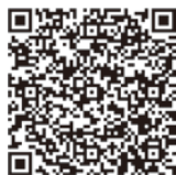
後期高齢者医療制度のページはこちら