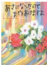
『あさになったのでまどをあけますよ』 荒井 良二/著

いつもの景色。大好きな景色。朝、窓を開けると、どんな景色が見えるでしょう。晴れの日、曇りの日、雨の日、雪の日、風の強い日、どんな日でも変わらずに、そこにある景色に温かく包まれて一日が始まります。 今日は、朝、窓を開けたらどんな景色が広がっているのでしょうか。窓を開けるのが楽しみです。