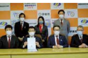
▲令和2年度政策提言

私の子どもと話をしている限りでは、仕事の問題さえクリアできれば、友達も近くにありますし、伊東で就職することがベストだとは思っていません。しかしながら、現状では本人も私も勧めたくない結論に至ります。そこを解決するために、本年度の政策提言を予定しています。