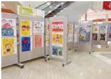
▲小学生人権ポスター、人権の花パネル展