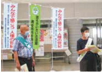
▲6月「人権擁護委員の日」・「男女共同参画週間」啓発活動