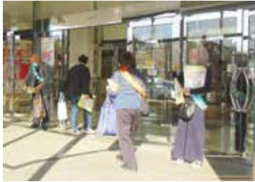
▲12月「人権週間」啓発活動