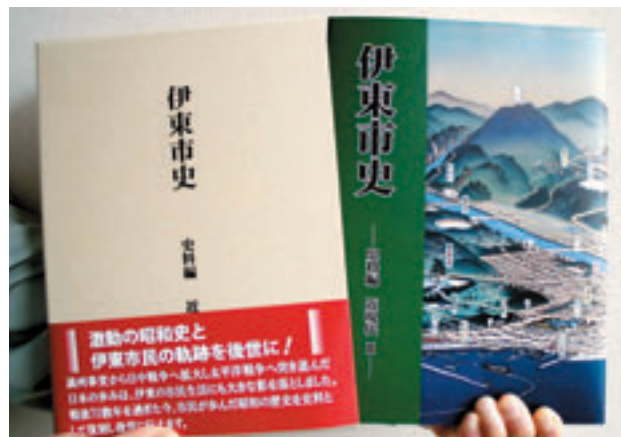
B5上製本792頁 頒価5,000円(税込み)

昭和14年に開通した熱海・伊東間の自動車道路は、昭和8年には下田まで延伸。続いて、昭和13年には国鉄伊東線が開通して、伊東は急激に観光地化が進みました。しかし、それも束の間、中国大陸で激化した戦争で市民生活は戦時態勢に入り、温泉町に傷病兵や東京からの疎開児童があふれる状態になっていきます。