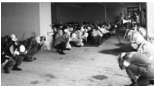
昨年のシェイクアウト訓練の様子