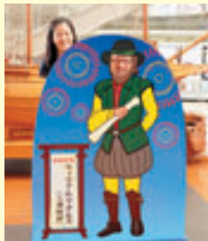
於 市役所1階市民ロビー