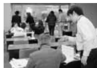
申告書の作成指導

事 = 事業所得等のある方、給 = 給与所得者の方、 年 = 年金受給者の方、市 = 市県民税申告の方、 譲 = 譲渡所得のある方（土地や建物、株式、ゴルフ会員権などを売った方）、 贈 = 贈与税の申告をする方（個人から財産をもらった方など）