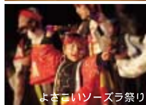
よさこいソーズラ祭り