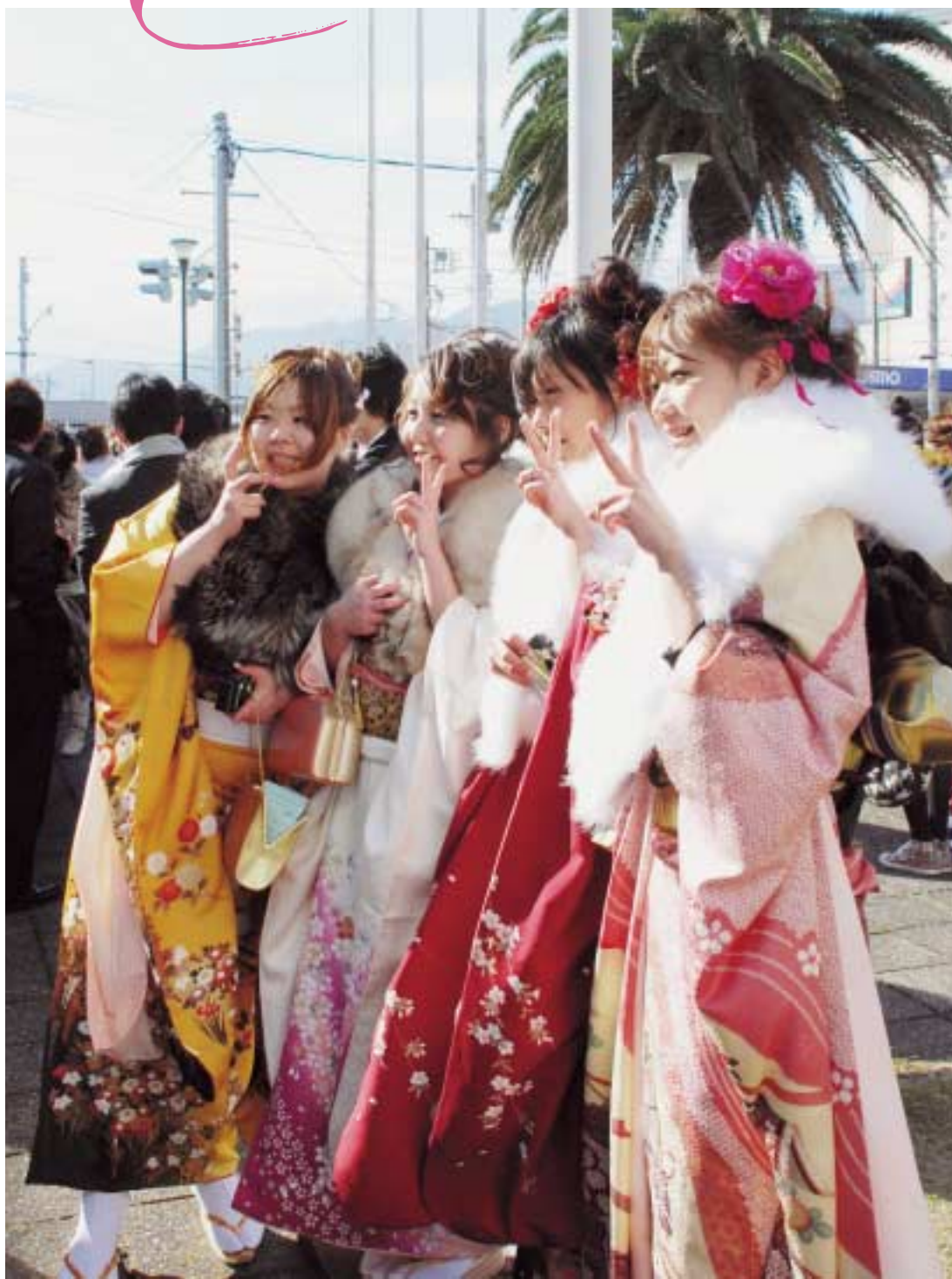
1月7日、成人式が観光会館で行われました。式典終了後、新成人たちは会場の外で、厳しい寒さと強い風にも負けず、お互い成人したことを祝い合い、喜び合いました。