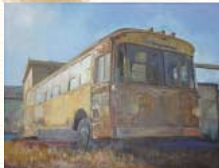
静岡県高等学校総合文化祭 第54回美術工芸展 優良賞 「栄光の果てに」

今はこんな姿のバスも、昔はたくさんのお客さんに乗せて道路を走っていたのだろう...、そんな昔の輝く栄光の姿も思い浮かべながら描きました。