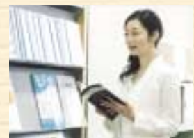
私も学んでいます