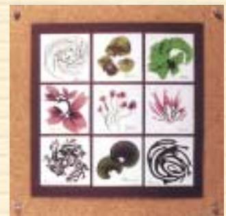
海藻おしばの作品

内容 潮の香りの中、海岸に打ち上がった赤や茶、緑などさまざまな色や形の海藻を素材として、作品を制作しています。色彩と造形の美に満ちた海の植物、海藻の世界をのぞいてみませんか。海藻おしばとして、すてきなオリジナル作品ができます。