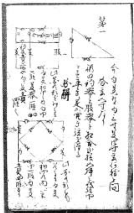
ピタゴラスの定理を解説する江戸時代の教本

筆者は古文書の解読を通じて市史編さん事業に携わっているが、古文書を読み解く場合、単に文字を筆写すればよいというものでもない。そこに用いられている言葉の意味に通じていなければ、正しい理解は得られない。江戸時代の税制、廻船(大型和船)の構造と航海技術、訴訟の仕組み等、学ぶべきことは多い。