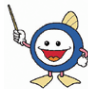
下水道 マスコット キャラクター 「スイスイ」