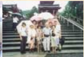
京都で現地の見学