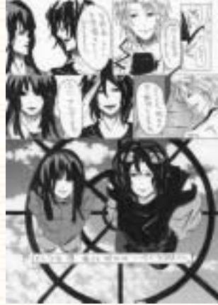
高校生デザイングランプリ2006 マンガの部 入選 「空職人」(全4枚)