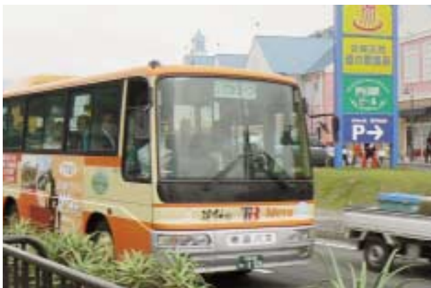
マリントウンからまちなかへ向かう按針号

実際に広報紙を手にとられる市民の方がご不便を感じる事がないうよう、市民の方の視点に立った広報紙づくりをさらに心がけて編集に努めていきます。