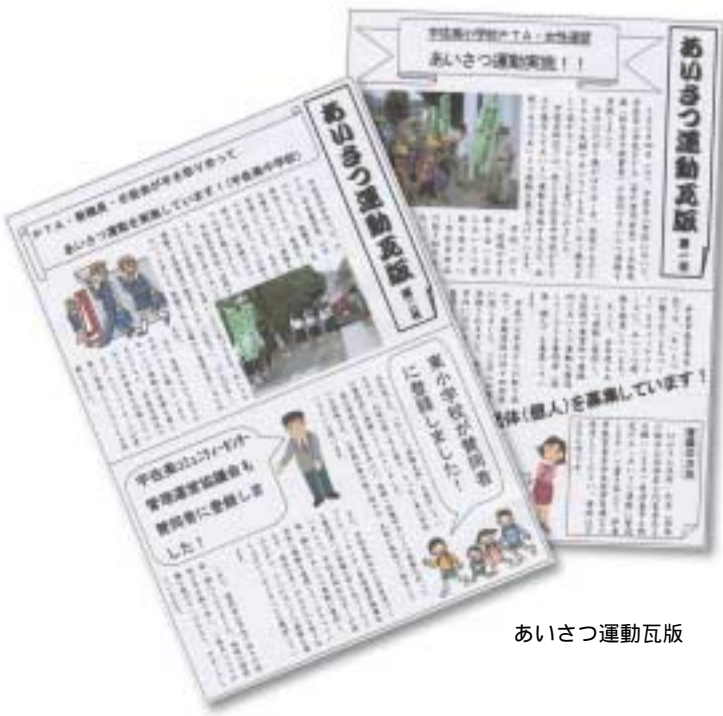
あいさつ運動瓦版

10月1日現在、賛同者は70団体・個人に達しており、着実に「あいさつの輪」が広がっています。また、女性連盟と宇佐美小児童愛育会が合同で朝のあいさつ運動をするなど、賛同者相互の連携も生まれています。