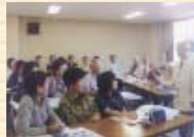
歴史がわかる講義

内容 今は、激動の幕末から明治維新、日清・日露戦争を勉強しています。今後は、現在の日本につながる昭和期の歩みを学びます。歴史を知る楽しさと喜びを体感できます。また、今年は京都へ出かけて、講義とは一味違う生の歴史に触れてきました。