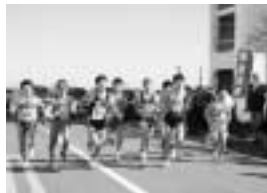
伊東駅伝競走大会