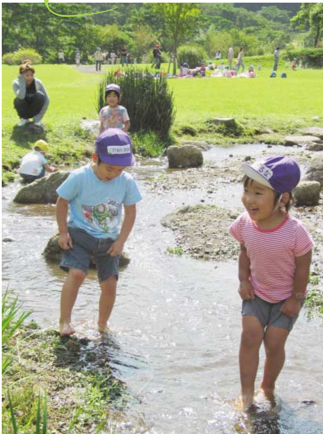
秋の遠足 さわやかな青空の下、富士見保育園・さくら保育園の子どもたちが、奥野ダム（松川湖）で豊かな自然に触れました。日差しの強さに夏を感じながらも、小川の水の冷たさには秋を感じたようでした。