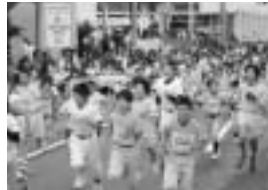
オレンジビーチマラソン