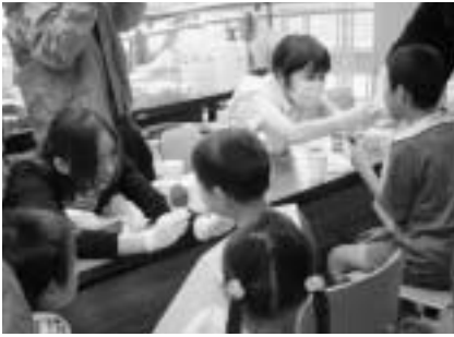
歯の健診（健康まつりにて）

申込み・お問い合わせは・・・ 保健福祉センター（健康推進課） ☎37-6321または ☎36-0111 内線2565～2567へ 土日祝日を除く