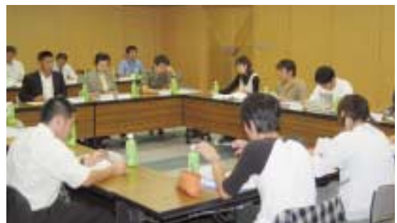
成人式実行委員会での協議の様子