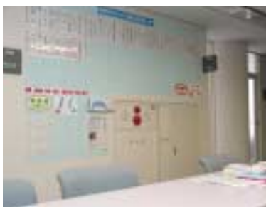
賛同者のお名前を紹介している 生涯学習課窓口