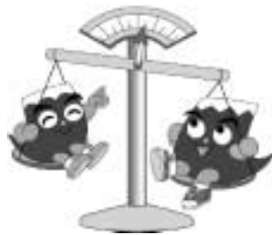
計量ふじっぴー