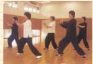
13式太極拳で健康づくり

脳も活性化され、筋力もつきますので、学ぶごとに日常生活が快適に過ごせます。ご自分の健康を自分の手でつくってみませんか。