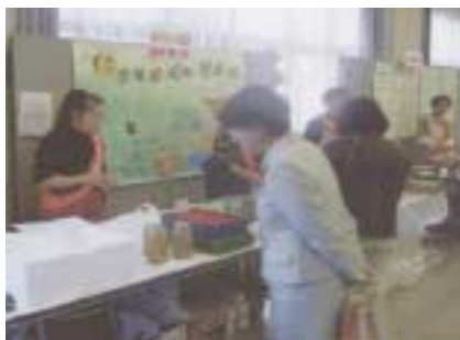
女性の会による出展