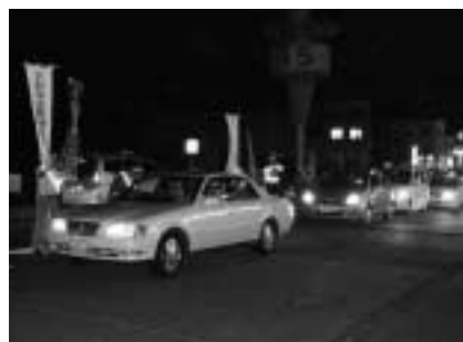
飲酒運転根絶・交通安全の呼びかけ

習的に飲酒運転をしている人もいます。飲酒運転の根絶には、運転者本人の自覚に任せるだけでなく、周りの人の力も必要です。