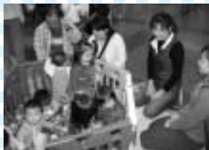
親子で1日楽しく遊べます（昨年の保育まつりの様子）