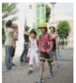
みんなで登校して みんなであいさつ

育てる上で重要な点として、次の3点を挙げています。 1 朝のあいさつのできる子にするには、親の方から呼び水・誘い水を出す。 2 両親が互いに、朝のあいさつを交換し合う。 3 しつけは早ければ早いほどしつけやすい。少なくとも小学校入学以前が望ましい。 これを踏まえ、今年度のあいさつ運動の重点を「小学校入学前の子どもを持つ保護者への働きかけ」として、キャンペーンを実施します。 具体的には、保育園や幼稚園を訪問し、教職員へあいさつ運動への協力を要請したり、チラシを配りながら直接保護者に話をしたりする予定です。 キャンペーンを通して、保護者の方々にあいさつの大切さやあいさつ運動の趣旨を訴え、伊東市の未来を担う子どもたちのよりよい成長を支援していきます。