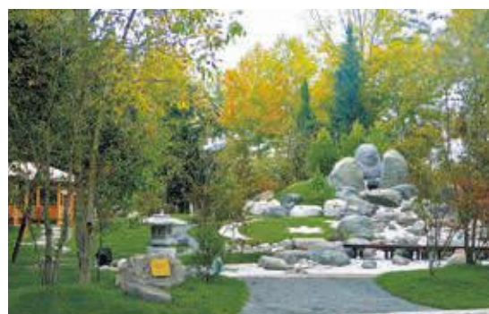
▲イスマイリ州の日本庭園