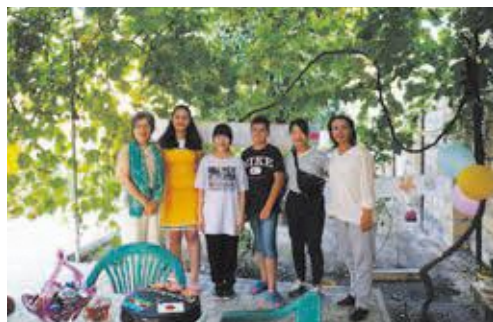
▲令和元年度の様子

平成27年度から夏休み期間 を利用した学生交換ホームス テイプログラムを実施してい ます。新型コロナウイルス感 染症の影響により、令和2年 度から中止していますが、今 後再開する予定です。