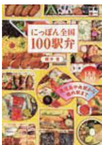
『にっぽん全国100駅弁』 櫻井 寛/双葉社

本書を出版した時には駅弁を6,000個完食していた著者が、鹿児島中央駅から稚内駅まで、日本全国の100個の駅弁を紹介。秋になり、外が涼しくなってきたら、駅弁を食べに旅に出ても良いかもしれません。