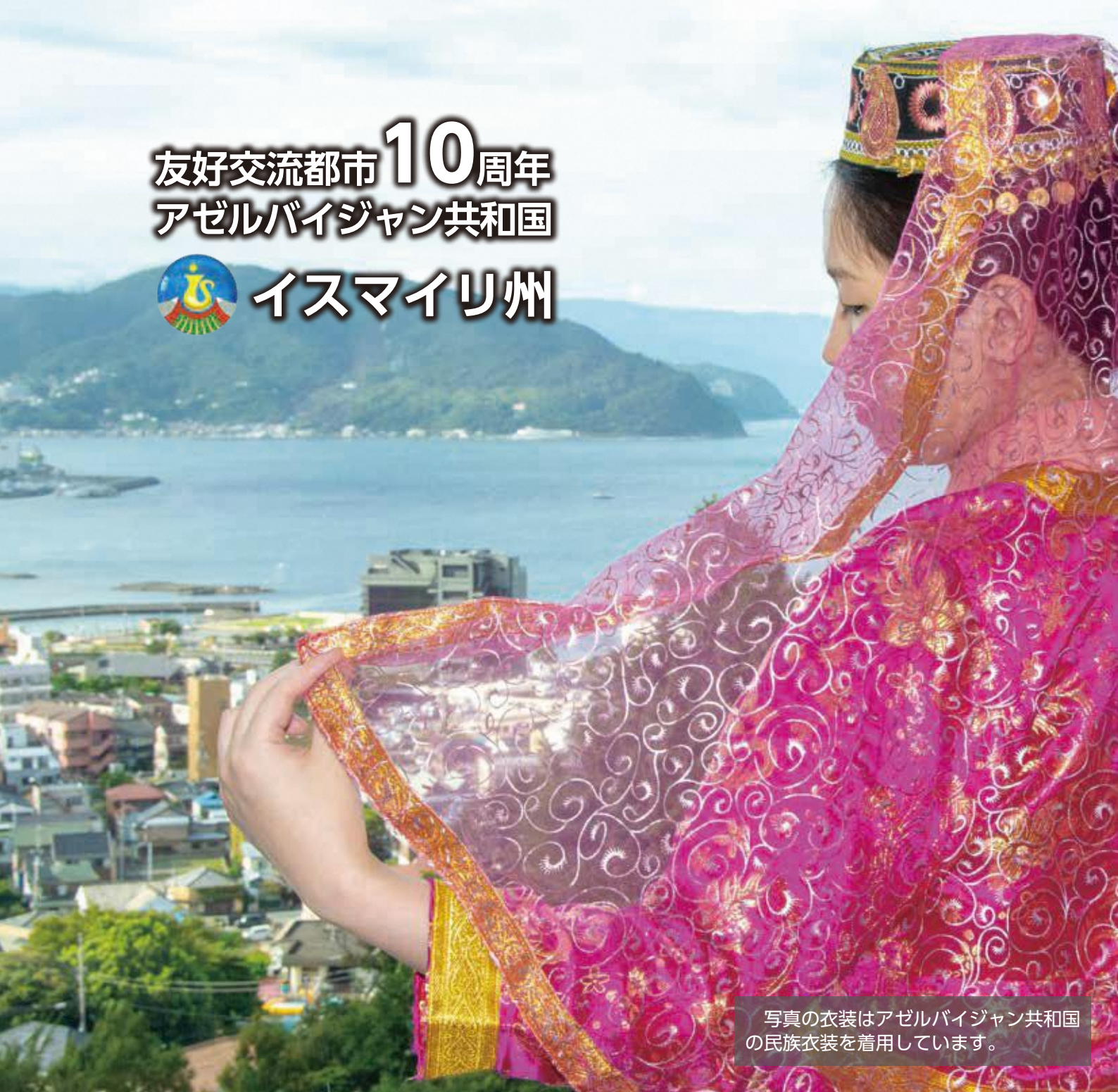
写真の衣装はアゼルバイジャン共和国の民族衣装を着用しています。