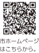
市ホームページはこちらから。

対象経費 令和5年4月1日～令和6年3月31日の期間に、婚姻を機に新たに要し、同期間に支払った次の経費