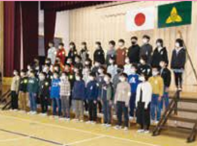
▲3月18日(土) 西小学校閉校式