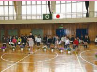
▲3月19日(日) 旭小学校閉校式

4月から統合により、伊東小学校となった東小学校、西小学校、旭小学校の閉校式が各小学校で開かれました。出席者はそれぞれの小学校への感謝を伝え、新たな伊東小学校への期待を膨らませました。式典はそれぞれの学校独自の内容で、記念講演や記念動画を披露し、校旗の返納を行いました。