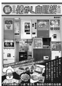
『新・日本懐かし自販機大全』 魚谷 祐介 / 辰巳出版

昭和40年代～50年代に見られた、麺類やハンバーガーなどの自動販売機。平成以降はその数も減り、見かける機会も少なくなりましたが、現役で稼働しているものもあります。あなたのオススメの一台があるかチェックしてみてください。