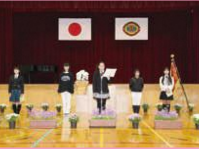
▲3月18日(土) 東小学校閉校式