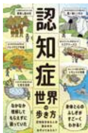
『認知症世界の歩き方』 寛 裕介/ライツ社

認知症のある人に見えている世界を旅行ガイドブックのように書いた本。認知症当事者が生きている世界を旅行ツアーに参加するように追体験することで、困りごとや付き合い方が見えてきます。認知症世界は異世界ではなく、ほんの少し未来の世界です。