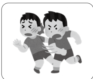
暴力や傷害行為によるけが