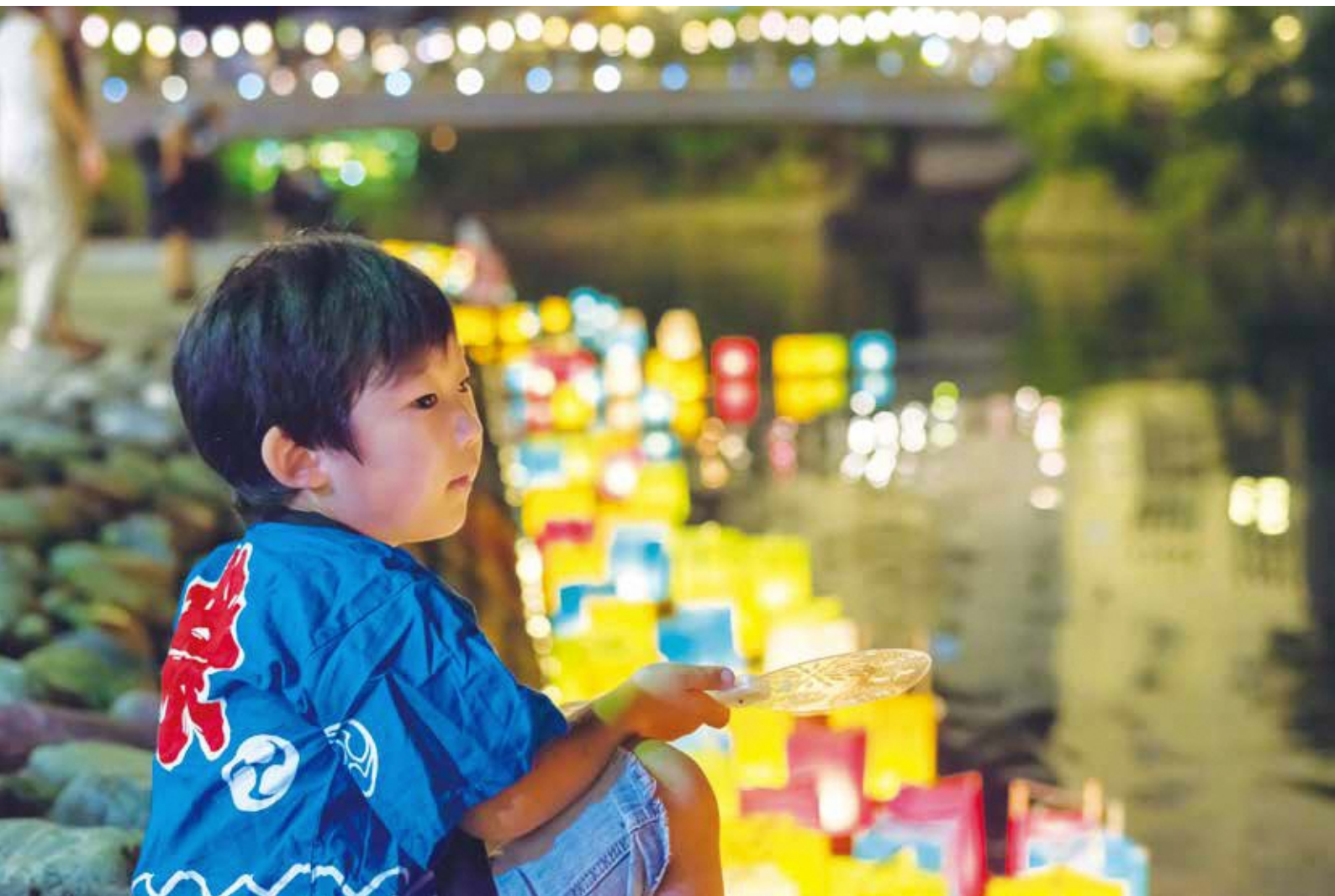
前回フォトコンテスト「教育長賞」受賞作品