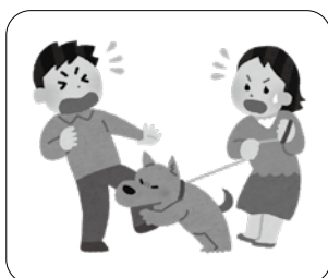
他人のペットによるけが