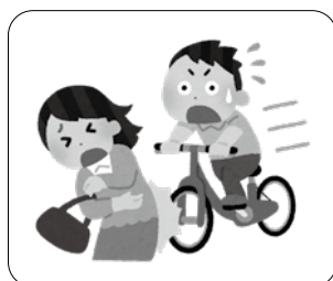
自転車による事故