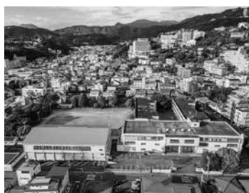
伊東市立西小学校

統合とは逆ですが、私が小学校4年生のときに旭小学校ができ、仲の良い友達と離れ離れになる経験をしました。中学校では、旭小学校の友達と再会し、さらに大池小学校の子どもたちとも一緒になり、新しい友達がたくさんできたことを覚えています。中学校で新しい友達が増える感覚を、この統合で少し早く経験することになると思いま