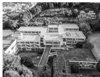
伊東市立旭小学校