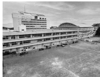
伊東市立東小学校