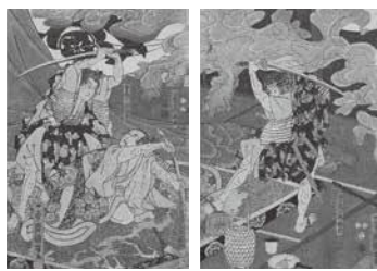
▲写真 歌川国芳作 『建久三年曾我兄弟敵討之図』 (教育委員会所蔵)