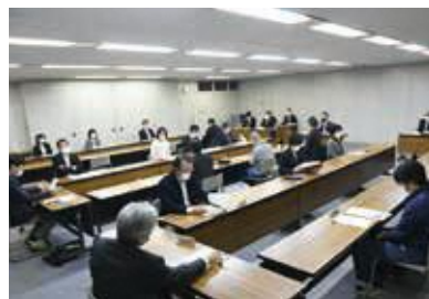
▲統合地域協議会の様子

とした事前交流の実施などを中心とし、統合先となる東小学校の施設改修、統合後の放課後児童クラブのあり方並びに閉校式典などについても報告事項として情報共有を図っています。