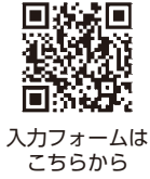
入力フォームはこちらから

申込み 5月7日(木)までに左記へ電話又は左記入力フォームから必要事項を入力してください。