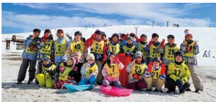
諏訪市内の交流（8年2月21日）

7年度に長野県諏訪市との姉妹都市締結60周年記念事業として、両市の小学生が相互に訪問する、子どもたちの相互交流バスツアーを実施しました。 8年2月21日(土)～22日(日)、伊東市の小学5・6年生16人が、諏訪市を訪問してきました。霧ヶ峰スキー場で、そり遊びやスノーシュー体験をし、雪国ならではのイベントを楽しみ、諏訪市の参加者とともに、本場信州のそば打ち体験や、ガラス工芸体験を行いました。