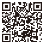
産前産後期間の免除制度はこちらから