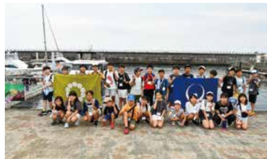
伊東市内の交流（7年8月9日）

7年8月9日(土)、諏訪市の小学生の子をもつ親子9組が伊東市を訪問してくれました。遊覧船の乗船や干物作り体験など、伊東市ならではのイベントを用意し、交流を深めました。