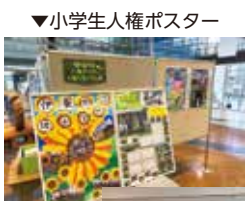
▼小学生人権ポスター

6月1日は人権擁護委員の日 人権擁護委員は法務大臣が委嘱した民間のボランティアで、いじめ、ハラスメント、DV、虐待などさまざまな人権問題に関する相談を受け付けています。