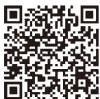
育児免除制度はこちらから