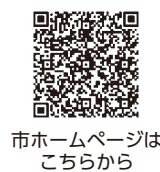
市ホームページはこちら