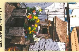
出来湯権現 川端康成「出来湯」