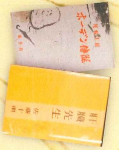
天城診療所跡 ★安吾と士郎の小説 登場先生の診療所