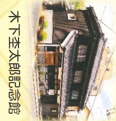
木下圭太郎記念館