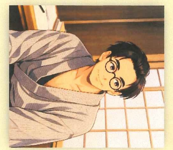
坂口安吾と尾崎士郎 (伊豆伊東にて)