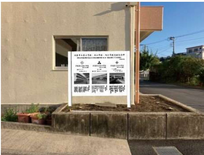
設置箇所イメージ図（児童玄関の脇）