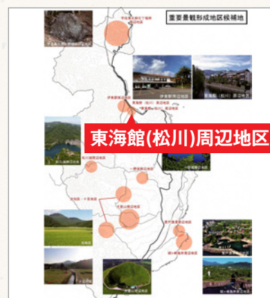
伊東市景観形成基本計画より抜粋

なお、お寄せ頂いたご意見は、原案と合わせて伊東市景観審議会や都市計画審議会等に諮り、最終案を決定します。最終案の決定後、伊東市景観計画の改定を行い、 令和7年4月に施行することを予定 しています。