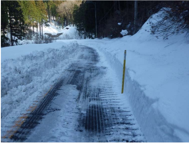
国道 138 号乙女峠付近(平成 26 年 2 月 14 日の積雪)