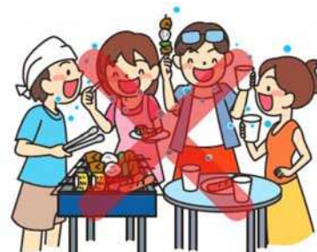
会話はマスク着用