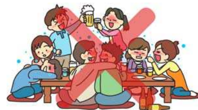
大人数の会食を避けてください