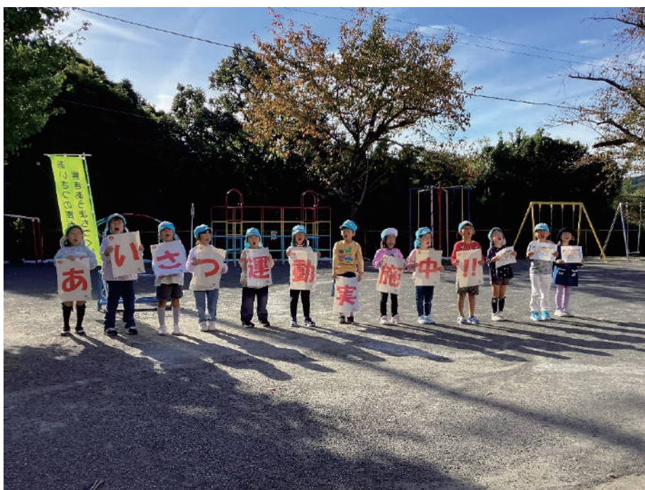
伊東市あいさつ運動の様子