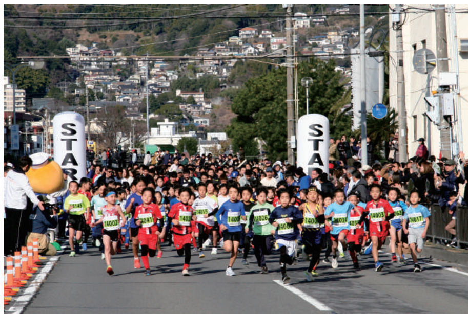
オレンジビーチマラソンの様子