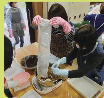
草木染めの体験をしました (西部農林事務所主催・浜松市)