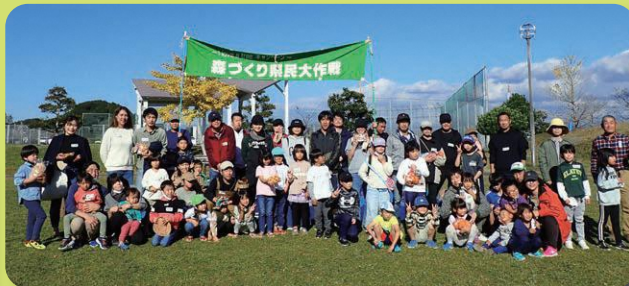
イベントに参加いただいた皆様で1枚!(中遠農林事務所主催・磐田市)