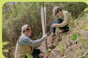
苗木の保護もしっかりと! (NPO法人ホールアース自然学校主催・富士宮市)