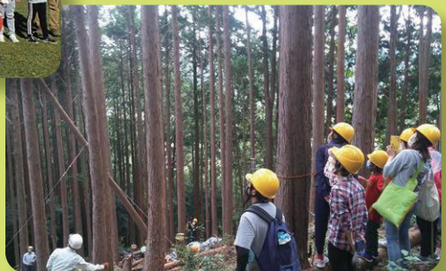
伐採見学。迫力満点です!(志太榛原農林事務所主催・島田市)