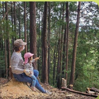
切り株でひとやすみ (森林づくり伊豆の会主催・伊豆市)