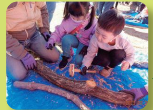
シイタケの植菌にチャレンジ! (NPO法人環境整備・森と竹で健康クラブ主催・沼津市)

静岡県内では、およそ180の森づくり団体が森づくりに関する様々な活動をしています。このうち約半数が、「森づくり県民大作戦」として自然とふれあえる活動やイベントを行っています。誰でも参加できるイベントもたくさんあるので、QRコードから検索して、ぜひご参加ください！