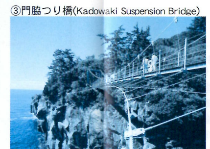
③門脇つり橋(Kadowaki Suspension Bridge)