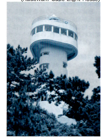
②門脇崎灯台(Kadowaki Cape Light House)