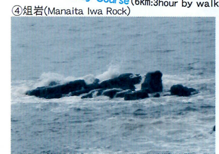
④組岩(Manaite Iwa Rock)