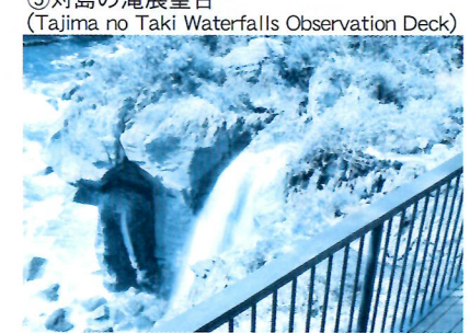
⑤対島の滝展望台(Tajima no Taki Waterfalls Observation Deck)