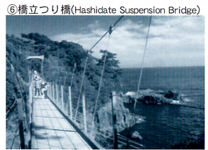
⑥橋立つり橋(Hashidate Suspension Bridge)