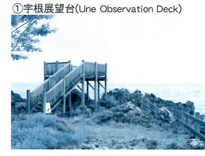
①宇根展望台(Une Observation Deck)