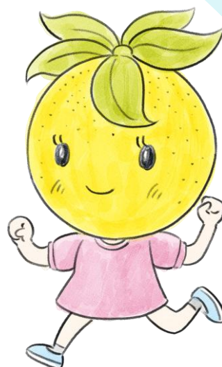
ニューサマーちゃん